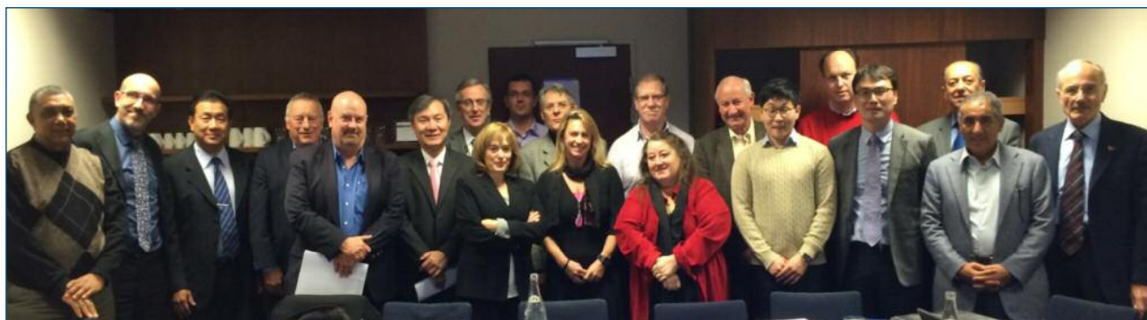
Fig. 2 I rappresentanti dei Paesi aderenti a IBEF, presenti a Parigi nel febbraio 2015

ciazione. Sono intervenuti vari rappresentanti del mondo industriale e tecnico del bitume e dell'asfalto. Con l'occasione è stata riassunta l'attività di IBEF nei 20 anni di vita ed è stato fatto un quadro del mercato attuale delle emulsioni, a cura di E. Le Bouteiller e di J-C. Roffè ( Fig. 3 ). Nel diagramma a barre è riportato il rapporto tra uso di emulsioni e di bitume tal quale; in Messico tale rapporto raggiunge il 40%. Un apprezzamento è stato rivolto al Prof. Giavarini, unico rimasto attivo dei sei fondatori "storici" di IBEF.