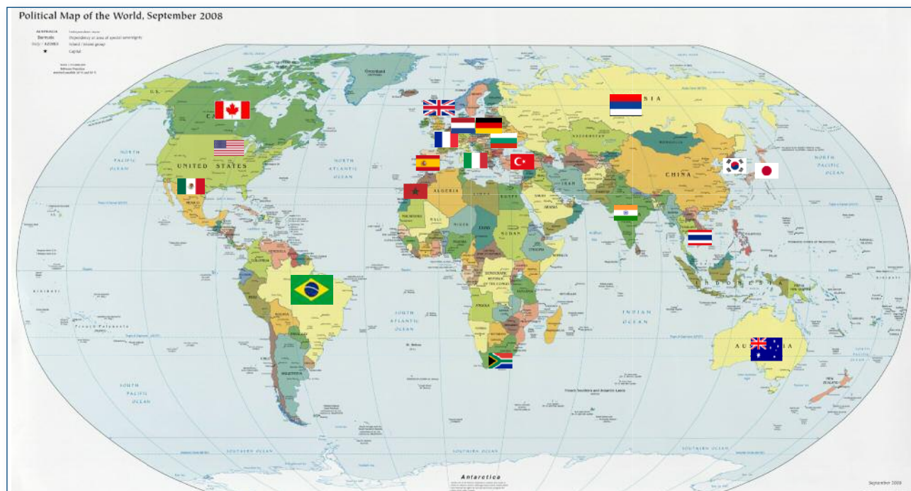
Fig. 1 | Paesi aderenti a IBEF

fondazione, il Consiglio Direttivo comprende per Statuto i sei membri fondatori dell'Associazione, tra i quali è stato fino ad ora scelto il Presidente. È allo studio un ampliamento a dodici membri, per dar